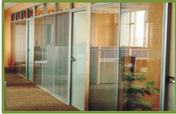
办公楼内隔断组合