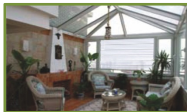
别墅内外空间组合